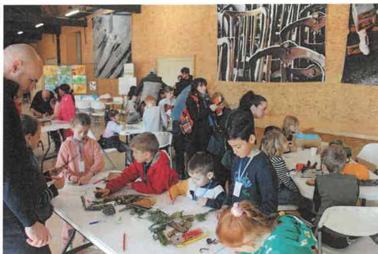
Une journée pour mieux connaître la forêt dans l'ancien site des usines réunies, conservatoire de la cité du meuble.