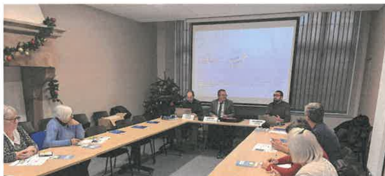
Les élus des communes concernées ont reçu les dernières informations en mairie de Vauvillers avant le déploiement final.

Il convient de se méfier des démarcheurs peu scrupuleux qui proposent de diagnostiquer votre matériel pour la mise en conformité en vue d'un raccordement ou de vous raccorder contre rétribution. Ces sollicitations constituent des démarchages abusifs voire frauduleux.