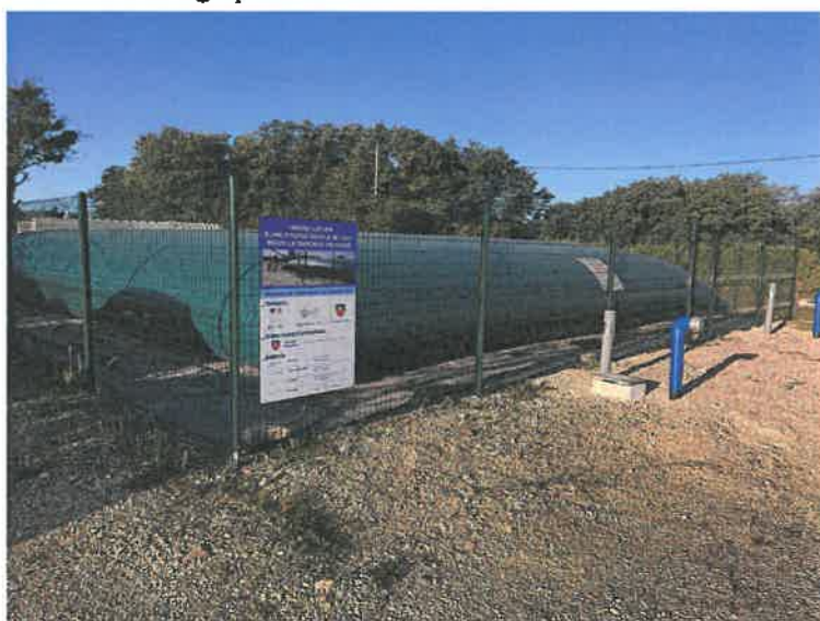
La citerne de 240m 3 a été implantée en concertation avec le service prévention du SDIS 70

Dans la nuit du 24 au 25 septembre 2013, un incendie qui avait pris naissance dans un système d'aspiration a ravagé 1000m 2 de l'entreprise Cofathim implantée au lieu dit Moulin de la Craye. Lors de ce sinistre l'intervention des pompiers avait été rendue difficile par le fait que le seul point d'eau disponible était situé à 1,6km et il a donc fallu tirer autant de longueur de tuyau. Pour pallier au défaut de borne incendie dans ce secteur isolé, où sont implantés deux entreprises, deux maisons d'habitation et la déchetterie (le diamètre de la conduite d'alimentation en eau ne permet pas l'installation de borne à incendie), la municipalité envisageait depuis plusieurs années l'installation d'une citerne souple. C'est chose faite depuis le mois de juin puisqu'une citerne de 240m 3 a été installée en bordure du CD 434 à un emplacement facilement accessible pour les sapeurs pompiers et à proximité immédiate des habitations. Cet équipement dont le coût s'élève à 25 439€ HT (30 527€ TTC) est financé à hauteur de 30% par l'état (7631 €) et 30% par le département (7631 €), le reste à charge pour la commune étant de 10177 €.