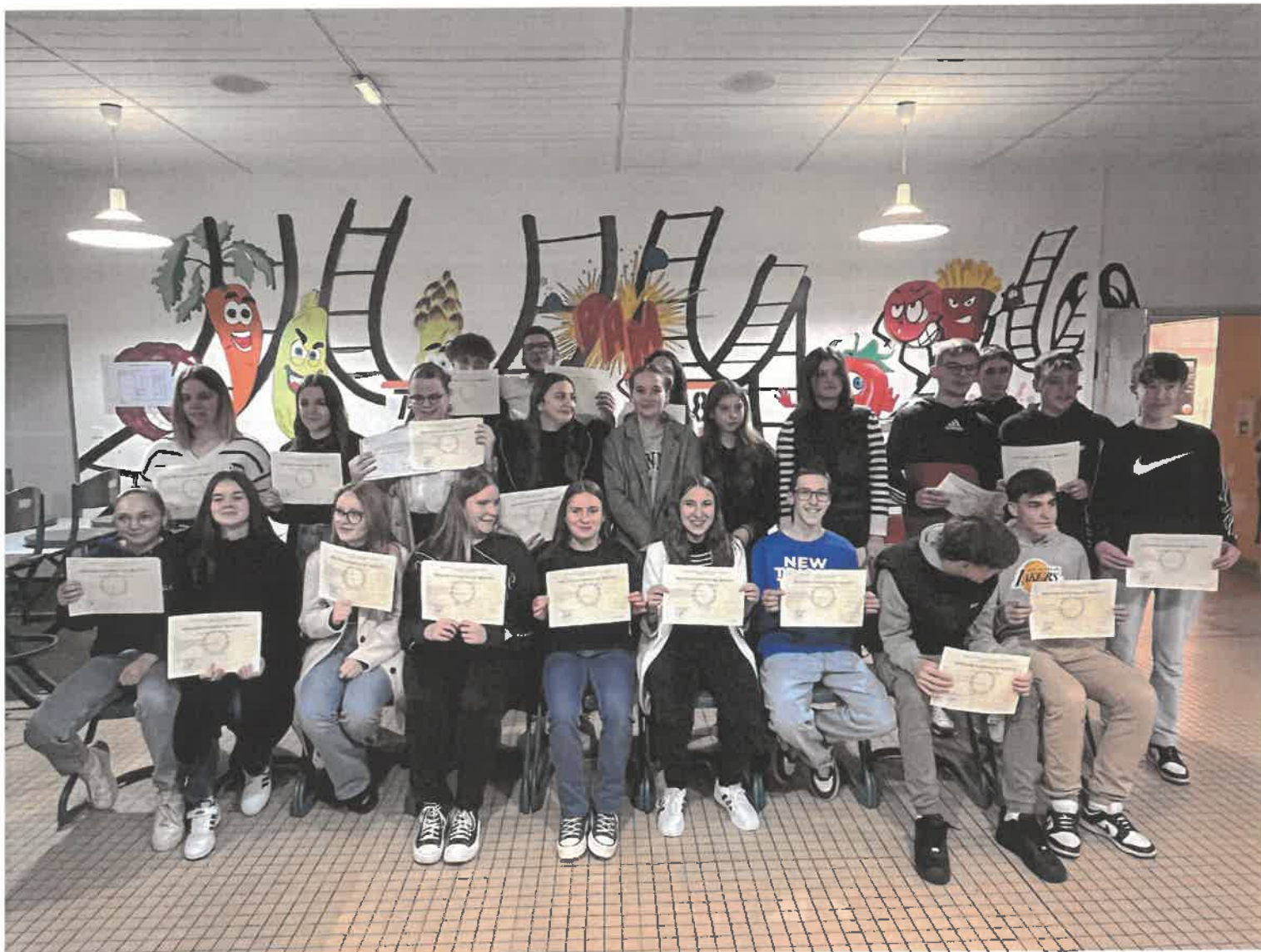
Les heureux lauréats du Diplôme National du Brevet 2023

Une collation préparée par le service restauration a permis de prolonger cette cérémonie. Les néo lycéens ont pu ainsi échanger sur leurs nouvelles expériences et orientations post-collège avec les professeurs, présents pour l'occasion et leurs parents.