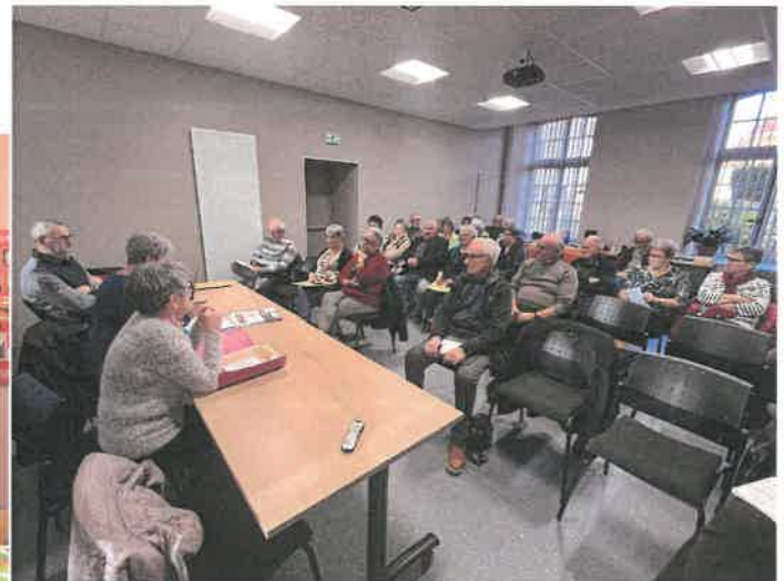
17 clubs des aînés du secteur Nord Haute-Saône étaient représentés

Après une collation offerte par le club local, les participants se sont quittés fort de ces nouveaux enseignements.