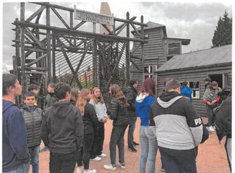
Les élèves devant l'impressionnante entrée du camp du Struthof.

Cette sortie scolaire particulièrement riche d'enseignement a été subventionnée par le comité du Souvenir Français de Vauvillers qui a financé une partie du coût du transport. Le président et la trésorière de ce comité accompagnaient les élèves pour répondre à l'une des vocations du Souvenir Français à savoir : la transmission du flambeau du souvenir aux générations successives.