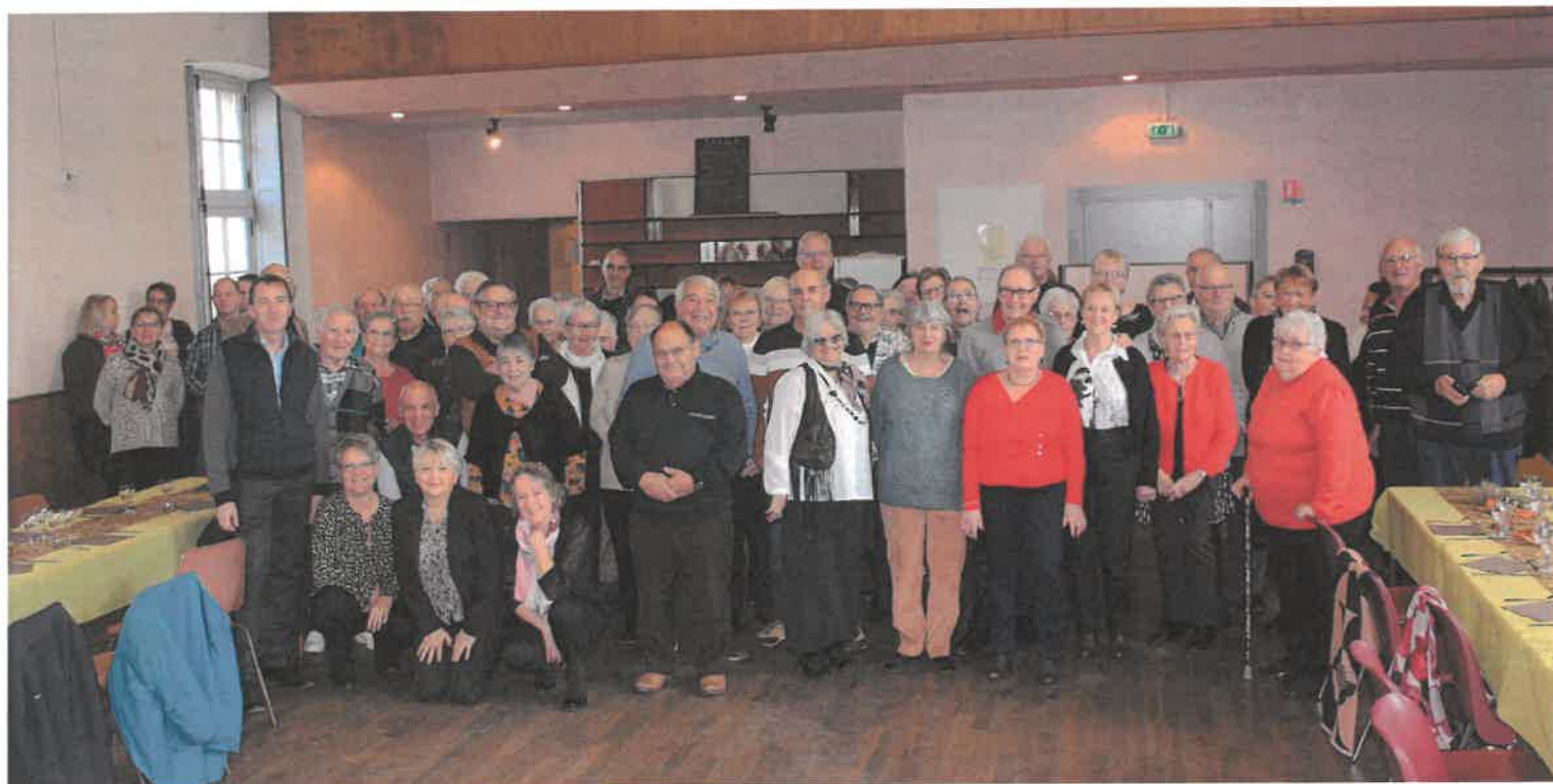
72 personnes se sont retrouvées à l'invitation du conseil municipal

En ce dimanche 26 novembre, les personnes âgées de 70 ans et plus, les employés communaux et les conseillers municipaux, étaient conviés pour partager le traditionnel repas annuel offert par la municipalité. Ce sont 72 convives qui se sont retrouvés à la salle des fêtes communale, entourés par les élus, pour partager ce repas confectionné par la boucherie «chez Hubert», la boulangerie « au Fournil de G » et l'épicerie Proxi.