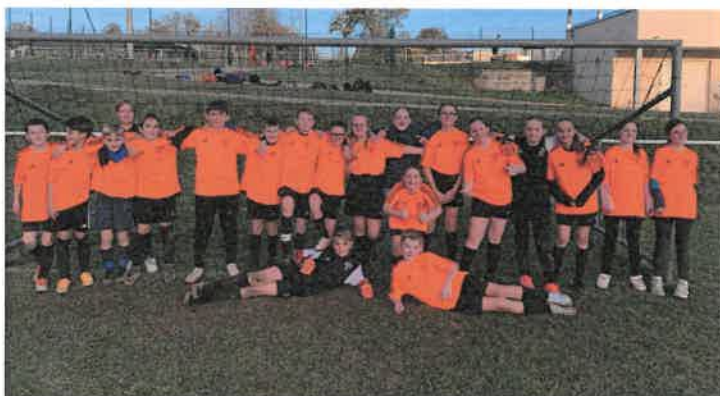
Les deux équipes benjamins et benjamines ont terminé au pied du podium.

Particulièrement active et dynamique, l'association sportive (AS) du collège Charles Péguy regroupe plus de 50% des collégiens dans les diverses activités proposées. Ce mercredi 8 novembre se sont les benjamins et benjamines inscrits à la section football qui ont fait le déplacement à Rioz pour participer à la finale départementale. Sans démeriter ils sont arrivés au pied du podium en s'adjugeant la 4ème place, tant chez les filles que chez les garçons. Endossant des responsabilités, ils ont également officié en qualité d'arbitre ou de coachs.