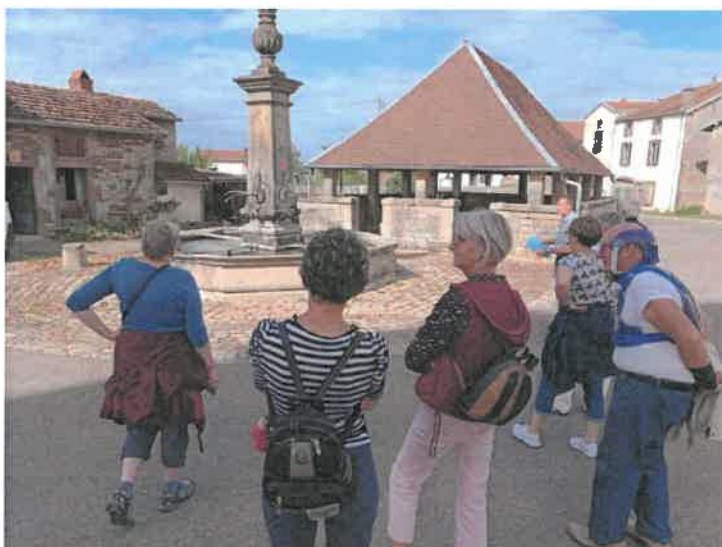
Le groupe devant la grande fontaine, inscrite au titre des monuments historiques.

Jusqu'en 1925 les habitants allaient chercher l'eau dans les fontaines et les nombreux puits présents sur toute la commune. Après 1925, l'eau fut accessible via des bornes fontaine installées dans les principales rues du bourg et ce n'est qu'entre 1953 et 1956 que l'eau des sources du Grand Bois du Morillon est arrivée aux robinets de chaque habitation, une évolution majeure qui a totalement changée le quotidien des Vauvillerois et Vauvilleroises. Aujourd'hui si cela nous paraît si évident que l'eau coule lorsque nous ouvrons le robinet, il nous appartient de penser à l'économiser car elle risque d'être de plus en plus rare.