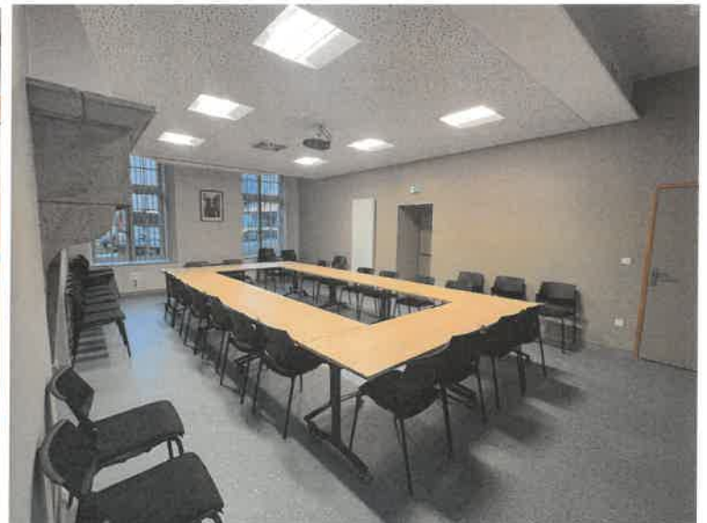
Un secrétariat de mairie et une salle de réunion plus fonctionnels et plus accessibles