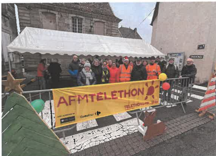
Un peu plus de 1000 euros ont été récoltés au profit du Téléthon