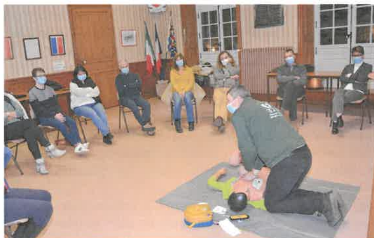
Savoir pratiquer les gestes de premiers secours

Onze personnes du village ont participé à cette formation, particulièrement intéressante, professionnelle et détaillée, dispensée dans la bonne humeur par un formateur en secourisme particulièrement qualifié : Alerte de secours, PLS, compressions thoraciques, gestes de premiers secours et bien évidemment utilisation du défibrillateur, rien ne manquait à cette soirée de près de 2 heures. Le défibrillateur, qui est installé dans le hall d'entrée de la salle des fêtes, est accessible 24H/24.