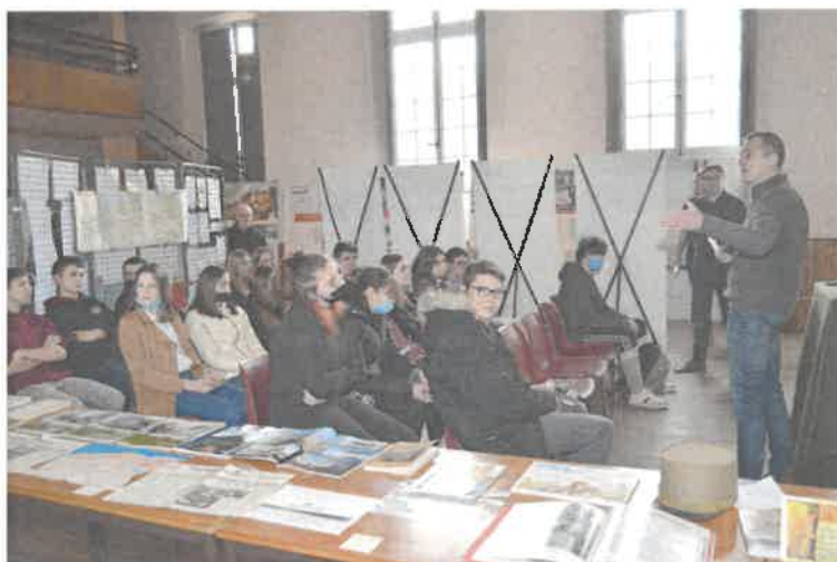
Les élèves de troisième du collège ont été accueillis par le président du comité des Trois Provinces du Souvenir Français

Pour commémorer le 60ème anniversaire des accords d'Evian, accords instaurant le cessez le feu en Algérie à compter du 19 mars 1962 à 12h00, pour rendre hommage à tous ceux qui ont combattu et ceux qui ont perdu la vie en Afrique du Nord, mais aussi pour enseigner et transmettre l'histoire aux générations successives, le comité des Trois Provinces du Souvenir Français a organisé une exposition intitulée « La Guerre d'Algérie, 60 ans après les accords d'Evian » les 17, 18 et 19 mars 2022 à la salle des fêtes de Vauvillers. Cette exposition, gratuite et ouverte à tous, a été mise en place grâce au concours de l'ONACVG 70 via les 23 panneaux « Histoire commune, mémoire partagée », d'un collectionneur d'effets militaires qui a permis aux anciens combattants de retrouver du matériel et des tenues utilisés en AFN et d'anciens combattants d'AFN du secteur qui ont fourni des photos et documents qu'ils avaient précieusement conservés. Des bons moments d'échanges intergénérationnels sur cette page de notre histoire qui reste très controversée mais dont il faut néanmoins parler pour qu'elle soit connue sous tous ses angles par les plus jeunes et qu'elle ne tombe pas dans l'oubli.