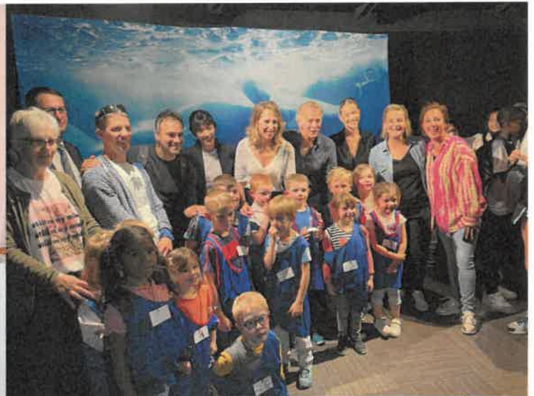
Photo souvenir à l'Aquarium de Paris