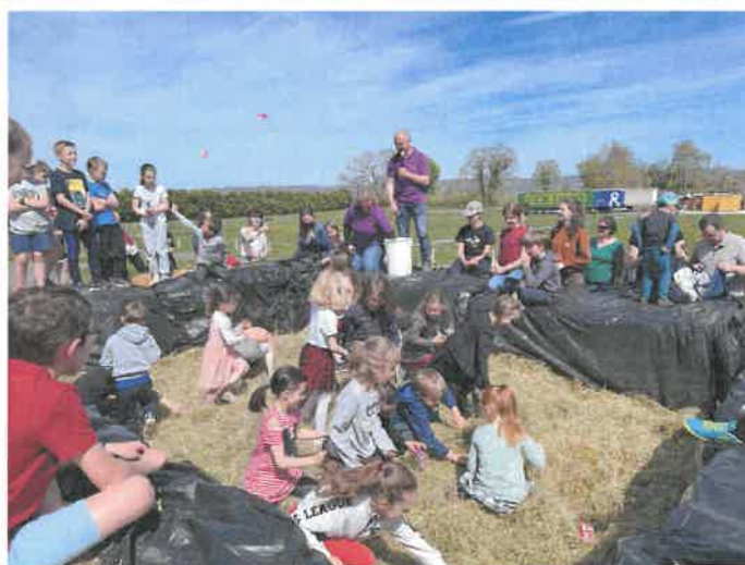
La piscine à foin toujours très prisée des enfants