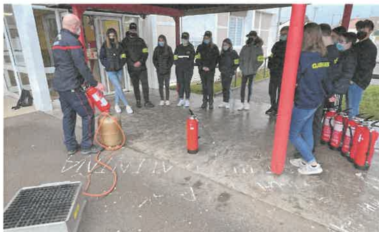
Les élèves ont appris à combattre un incendie

Au cours de cette journée, les 15 volontaires présents ont reçu une information sur la réglementation et la prévention dans les établissements recevant du public (ERP) ainsi que sur les différents feux et les moyens de les combattre, information complétée par des exercices pratiques. Ainsi formés aux gestes de premiers secours ils deviennent des assistants de sécurité lors des exercices d'évacuation ou de confinement dans leur collège. Souhaitons que cette expérience enrichissante puisse susciter des vocations et favoriser un engagement ultérieur des élèves chez les sapeurs pompiers.