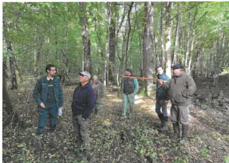
Une sortie en forêt, riche en enseignements.

Une belle après-midi instructive au contact de la nature, qu'il convient d'écouter et de respecter.