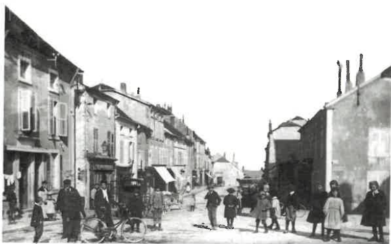
La Grande rue