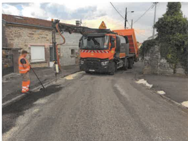
Le camion Blow patcher en action dans la rue de la Maladière

Souhaitant porter un effort sur l'entretien de la voirie, fortement dégradée à certains endroits du village (certains secteurs n'avaient pas été entretenus depuis plus de 20 ans) la municipalité a missionné l'entreprise COLAS dotée d'un « blow patcher » (enrobeur-projeteur), une machine qui permet de créer un enrobé émulsion de bitume sur toute la profondeur des dégradations. Cette technique nouvelle a pour vocation de transformer des réparations d'urgence de la chaussée en réparations durables. Ainsi, durant trois jours, l'équipe d'entretien est intervenue dans de nombreuses rues (Lotissement des acacias et Perot, rue de la Grande Fontaine, rue Notre Dame, rue de la Maladière, rue de la Prauduc, rue du Versaille, ancienne route d'Anchenoncourt, Chemin du Château d'eau et grande tranchée dans les bois communaux). Pour un montant de 9600 € HT ces travaux offriront plus de confort aux usagers mais permettront également, dans certaines rues, de donner une autre vision que des caniveaux dégradés et jonchés d'herbes. Ces travaux se poursuivront dans d'autres secteurs les prochaines années.