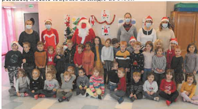
A la maternelle

Le confinement étant levé, le père Noël a pu effectuer comme prévu sa tournée au pôle éducatif St-Exupéry où les enfants l'attendaient avec impatience. C'est donc masqué et en respectant les gestes barrières qu'il a effectué sa tournée, distribuant cadeaux et friandises. En retour, il a eu un accueil des plus chaleureux de la part de tous les enfants et plus particulièrement ceux de la maternelle qui lui avaient préparé une chanson et une danse ainsi que des gâteaux. Et le lendemain, il a accueilli les enfants non scolarisés en mairie. Heureusement qu'en cette période de pandémie les traditions ne se sont pas perdues, il reste toujours la magie de Noël.