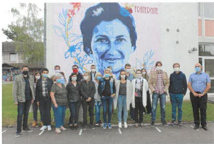
Toute l'équipe de Laurent Esteve sous le regard bienveillant de Simone Veil

165 élèves sont accueillis au sein de 8 classes pour une année scolaire qui sera encore placée sous la contrainte d'un règlement sanitaire qui oblige le port du masque tant par les enseignants que par les élèves.