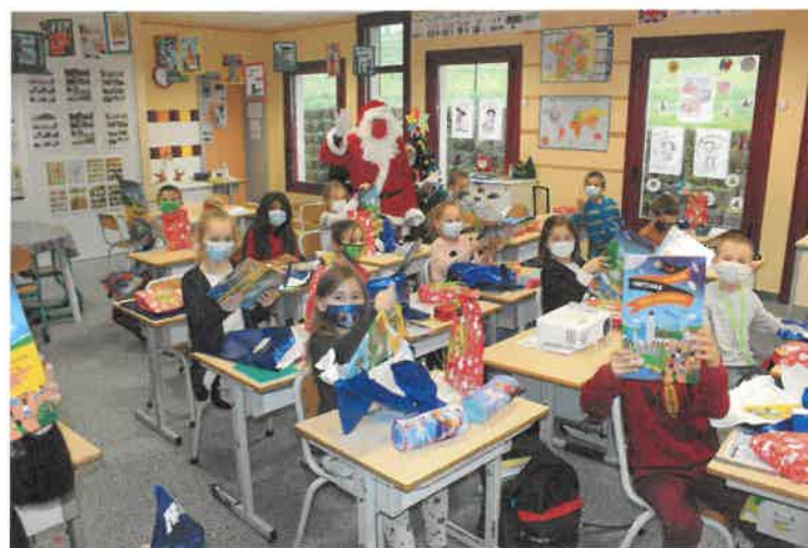
Chez les CE1