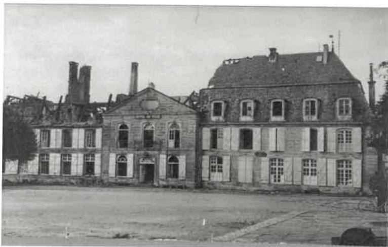
L'incendie du Dimanche 2 août 1931 survenu à 12h15