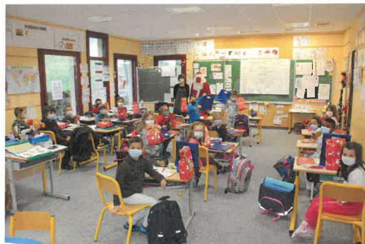
Chez les CP