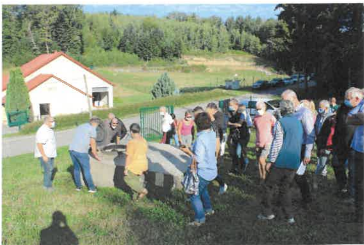
A la station des sources du Belier à Gruery les Surances (88)

Tous les élus présents, qui pour la plupart découvraient le réseau du syndicat, ont loué l'excellent état d'entretien et de fonctionnement de toutes les installations et n'ont pu que se féliciter de disposer d'un telles installations qui leur offrent une eau d'excellente qualité.