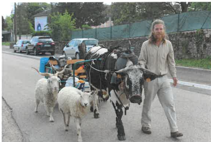
L'équipage en route pour Amance

Au matin il a repris sa route en direction d'Amance, libre comme l'air et loin, bien loin de nos soucis quotidiens.