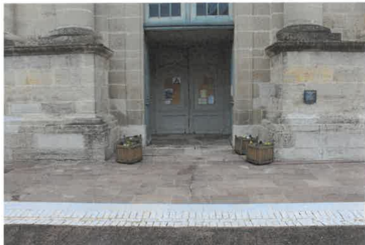
Un coup de propre du plus bel effet pour notre église

Cet acte de bénévolat totalement désintéressé est à mettre en avant et nous remercions tous ceux qui, d'une manière ou d'une autre, on fait leur part à proximité de chez eux. Il est difficile de tous vous nommer tant vous avez été nombreux à vous retrousser les manches pour la bonne cause. Participer à l'entretien et à la mise en valeur de notre commune est un acte citoyen dont personne ne doit avoir honte, bien au contraire. C'est la conjonction de la participation de chacun d'entre nous, à hauteur de ses possibilités, qui fera que nous pourrons retrouver une commune propre.